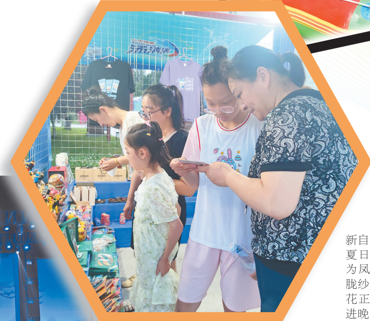
↓汤原文创产品火爆热销。

该法院联合县综治中心对特殊未成年做好心理咨询及心理疏导工作,在县民政部门结婚、离婚登记处放置“关爱未成年人”提示卡,巩固“假期护苗”工作成果,在寒暑假等节假日对县辖区娱乐场所进行联合整治。