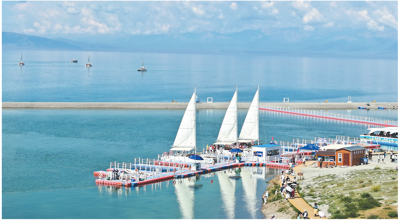
这是2025年7月17日在新疆博尔塔拉蒙古自治州赛里木湖景区拍摄的电动帆船游玩项目(无人机照片)。

报告指出,中国加快推动产业结构调整优化,促进经济社会全面绿色转型,不断提升绿色低碳产业在经济总量中的比重,推动形成绿色生产方式和生活方式,