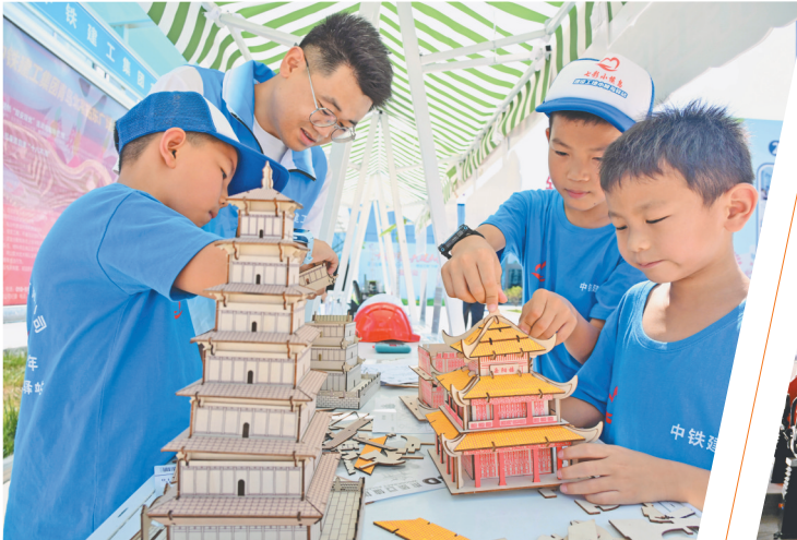
8月12日,在山东青岛,2025年建设工地“小候鸟”驿站暑托班的孩子们在拼装建筑模型。