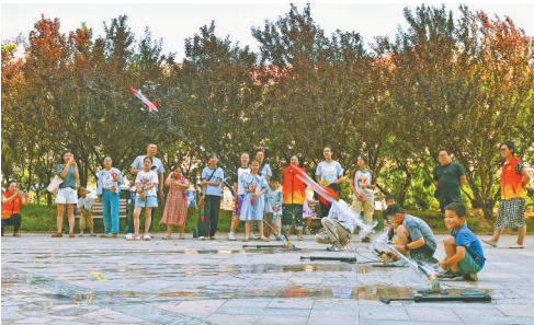
8月12日,小朋友在山东省烟台市福山区银河明珠社区暑期科普公益课堂上发射自制的“水火箭”。