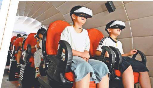
8月12日,在河北省石家庄市一家航天科技体验馆,小朋友在模拟太空舱内体验。