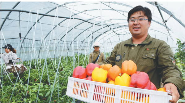
定制蔬菜丰收了。