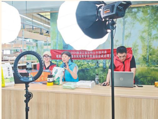
直播技艺越来越娴熟。