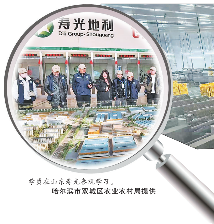
学员在山东寿光参观学习。

“截至目前,双城区已形成‘学用贯通、产教融合’的良性机制,培育出一批懂技术、善经营、敢担当的高素质农民。”随着学以致用的成果不断落地,大家对未来更是充满信心,“我们将持续深化跟踪服务,助力学员成为乡村振兴的主力军,为农业农村现代化谱写新篇章。”徐为说。