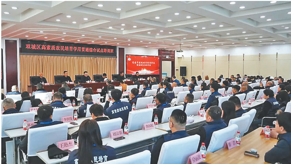
开班仪式。

他山之石,可以攻玉。对学员们来说,产业发展先进地区的实践经验是最有用、最直观的“教材”。外出实地观摩学习,才能找到差距、开阔眼界、求取“真经”。创新班学员在寿光市农产品物流园了解了供应链管理知识,从产地预冷到分拨调度,学得清晰透彻;在浙江省杭州良渚麟海蔬果合作社,大棚内无土栽培的番茄让大家眼前一亮,合作社年轻人手机直播采摘的销售模式打开了大家的销售思路。CEO班学员在河南丰乐农现代农业区参观了连片的智能温控大棚,高效的管理模式引发了他们的浓厚兴趣;在四川省农科院示范园,耐盐碱的黑小麦品种也让大家大开眼界。