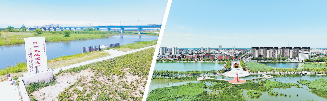
“江桥抗战纪念馆”纪念碑。

在齐齐哈尔市泰来县江桥蒙古族镇,嫩江畔,一块写着“江桥抗战纪念馆”的石碑庄严矗立。94年前,中国军队有组织、具规模抗击日本侵略者的第一场战役在这里打响,江桥抗战展现了黑龙江爱国军民守土有责的朴素家国情怀,敢于首赴国难的担当意识,点燃了民族抗争的熊熊烈火。 由于当时国民政府对日本侵略采取了消极政策,致使日军在轻易攻陷辽、吉两省后,开始进犯黑龙江省,欲吞并东北全境。1931年10月,时任黑龙江省政府代主席兼军事总指挥的马占山,决心组织抵御。 嫩江是守护当时黑龙江省省会齐齐哈尔的天堑,日军要进犯黑龙江,必须要跨过嫩江,而在当时,江面并没有完全结冰,嫩江上的铁路桥就成为争夺的对象。为了防止敌军通过大桥,马占山让驻军烧毁嫩江桥桥面并毁坏5座桥梁中的3个。 1931年11月4日,日军在飞机、大炮和装甲车掩护下,出动4000多敌寇,向嫩江桥发起进攻。中国守军奋起还击,江桥战役正式打响。日军装备精良,狂言“3日拿下黑龙江”,可他们没想到中国士兵敢把手榴弹绑在身上,滚进日军的坦克群,