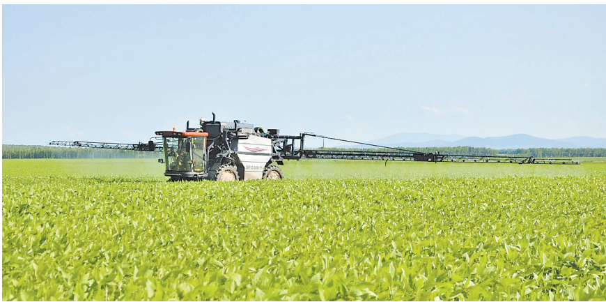
大型机械在田间作业。

饶河县西风嘴子的挠力河岸边,初秋的风拂过广袤的湿地,芦苇荡里传来清脆的鸟鸣。近日,记者走进这里,这片如今静谧祥和的土地,80多年前曾是烽火连天的革命战场——1938年,东北抗日联军第七军在这里打响了著名的西风嘴子伏击战,创造了以零伤亡全歼小股日军的辉煌战绩。在这场战斗中,击毙了日军少将日野武雄,这是东北抗联首次击毙日军少将。 西风嘴子位于饶河县饶力葛山北端,西距小佳河镇15公里,最高峰海拔118米,地势险要。岁月流转,昔日的枪林弹雨早已散尽,红色基因却在这片土地上深深扎根,催生出蓬勃的发展活力,让西风嘴子从革命战场蜕变为充满希望的发展热土。 “当时,第七军决定由第一师副师长姜克智率部在西风嘴子伏击该股日军。他们带领战士们在芦苇荡里潜伏了三天三夜,就等着日军汽艇进入伏击圈……”在西风嘴子伏击战遗址旁,饶河县革命老区