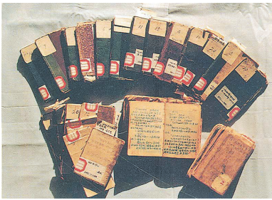
周保中所写的抗联日记。