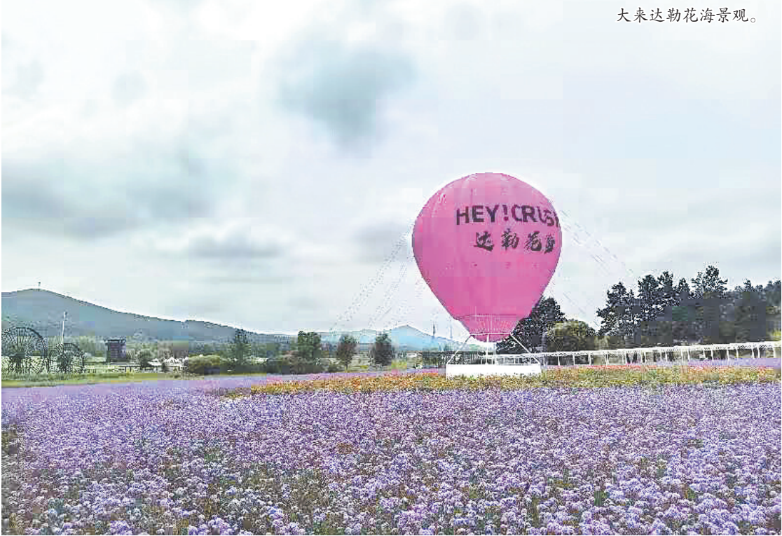
大来达勒花海景观。

初秋的风拂过坡地,紫色的薰衣草花穗翩翩摇曳,弥散一片梦幻。紫色的阳光淌过花穗,碎成星子落进紫海里,洒在每朵小花上。我们漫步花间木栈