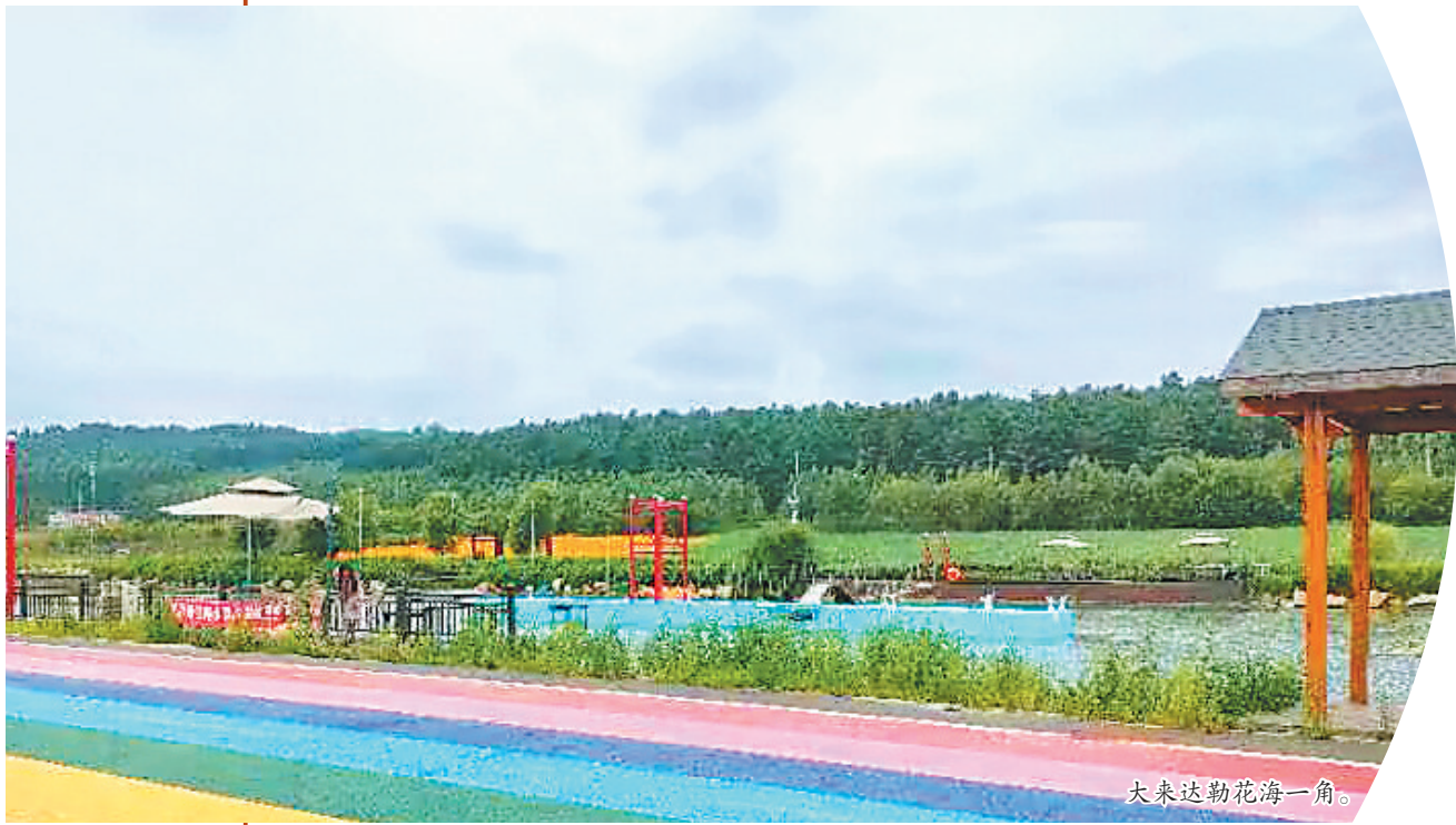
大来达勒花海一角。

太阳变成了大大的溏心蛋黄,和我们躲起了猫猫。在转身之间,我满是不舍,已将这美好的盛景藏在心底,待忆起时,仍沉醉这片花海,重温与自然、与家国的深情对话。