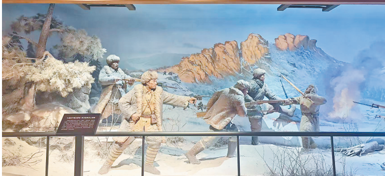
七星山红色抗联体验馆里的七星砬子保卫战模拟场景。