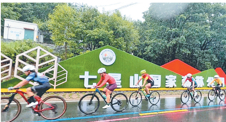
七星山公园里的自行车比赛。