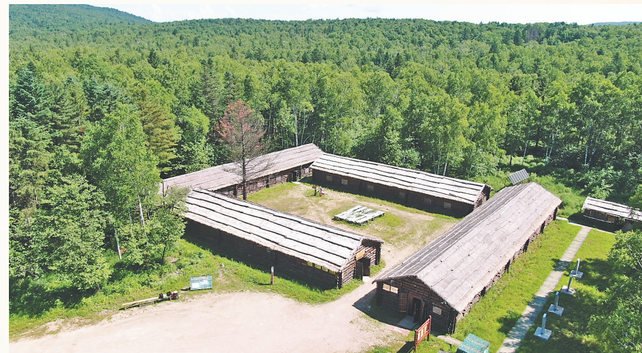
红松林里的东北抗联第六军密营遗址。