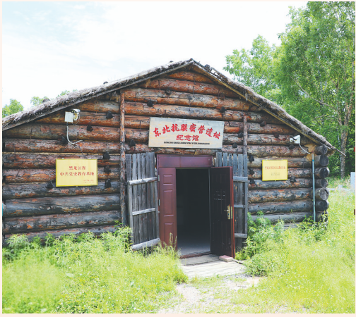
上图: 东北抗联七星砬子兵工厂的机床。 下图: 位于汤原县的东北抗联密营遗址纪念馆。

坏。1955年,黑龙江省博物馆和东北烈士纪念馆文物征集人员在七星砬子山里挖掘出这台机床和一些零部件,为研究东北抗联后方基地建设提供了有价值的实物资料。