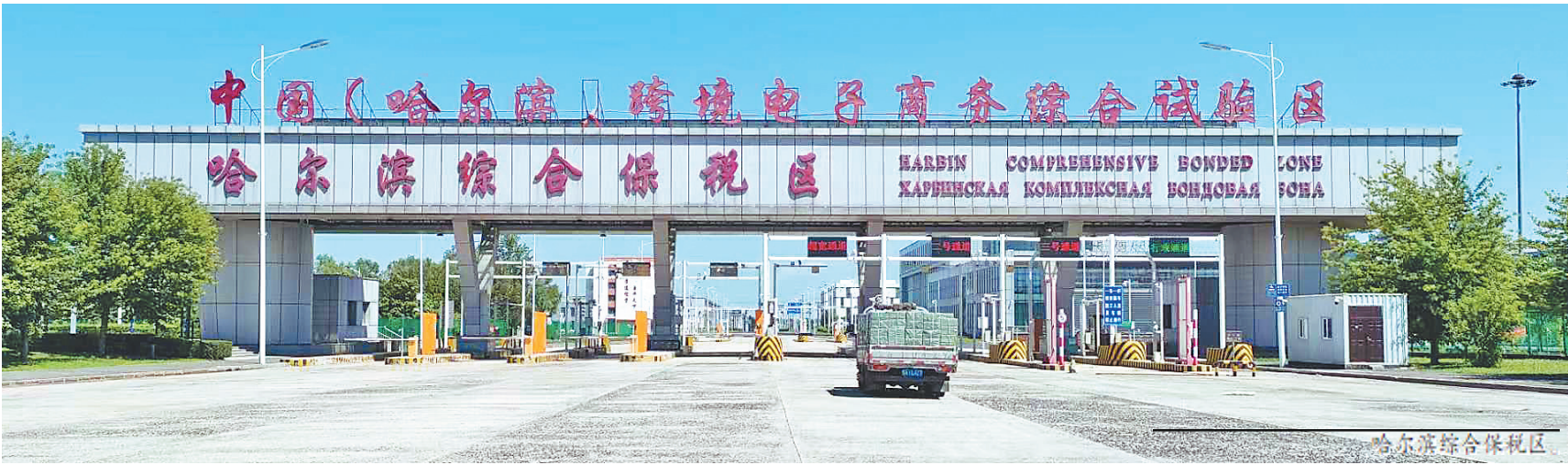
哈尔滨综合保税区

我省深挖冰雪文化内涵，培育冰雪活动品牌，相继举办哈尔滨国际冰雪节、松花江采冰节、冰灯艺术游园会、冰雕雪雕比赛等冰雪文化特色活动，充分展示冰雪文化独特魅力。连续两年在哈尔滨冰雪