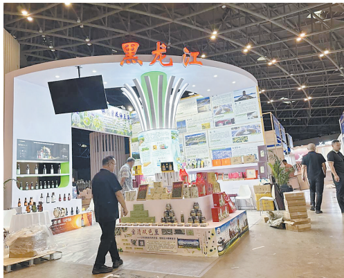
中国国际商标品牌节黑龙江省展区

来自国家知识产权局有关司局、山西省及太原市有关部门、各级市场监管(知识产权)部门的领导,世界知识产权组织等相关机构的代表,中外知名企业家、知识产权专家学者、商标代理机构等各个方面的人士约3500人参加了活动。