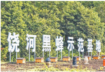
饶河黑蜂示范基地。

数字经济时代,电商直播已成为地理标志产业发展的标配。省知识产权局指导相关地市运用VR等数字化方式展示地理标志产品的种植、收获过程等,以新鲜的跨界碰撞方式,让更多人沉浸式感受地理标志的魅力。