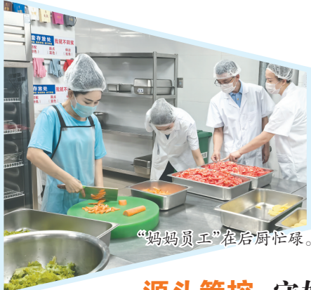
“妈妈员工”在后厨忙碌。

该集体配餐公司工作人员告诉记者,“万能蒸烤箱”已成为操作间的明星设备。它能蒸、烤、炖、烘焙,单次可处理30~90公斤菜品。“使用该设备可以大大提高烹饪的安全性、灵活性和效率。”工作人员介绍,设备还能自动调节温度与蒸汽,保留青菜的维生素含量和脆嫩口感,更加美味,解决一些孩子不愿意吃青菜的问题。