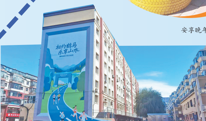
工农区居民楼体上的彩绘。