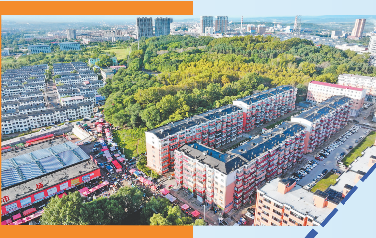
新老小区相得益彰。