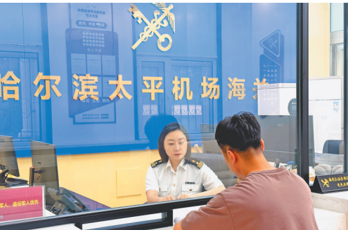
哈尔滨太平机场海关关员对报关企业进行指导。

未来,哈尔滨太平机场海关将继续发挥海关职能作用,以更加务实的举措助力哈尔滨空港型国家物流枢纽建设,为开放龙江“物流新动脉”加速形成贡献海关力量。