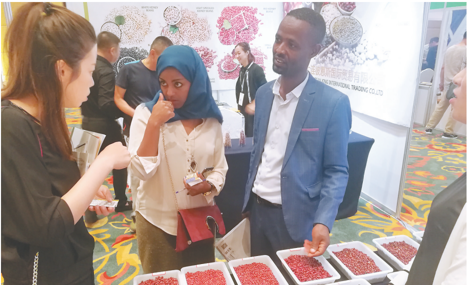
宝清县溢通农产品购销有限公司的红小豆、黄豆、黑豆等农产品受到外国采购商青睐。