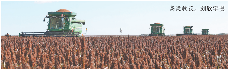
高粱收获。

据了解，海伦市共有504万亩耕地，今年大豆种植面积达216.4万亩。近年来，海伦市大豆优良品种推广应用率超90%，优质大豆生产优势显著。自2016年以来，海伦大豆年种植面积始终稳定在200万亩以上，历年平均亩产超320斤；2024年亩产达346斤，总产7.8亿斤；今年有望实现亩产350斤以上，总产突破7.5亿斤。