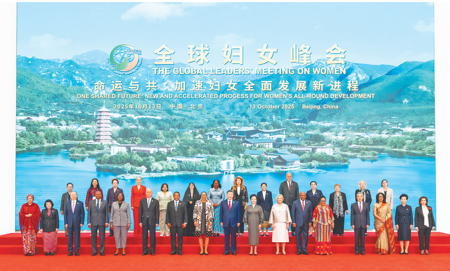
10月13日上午，国家主席习近平在北京国家会议中心出席全球妇女峰会开幕式并发表主旨讲话。