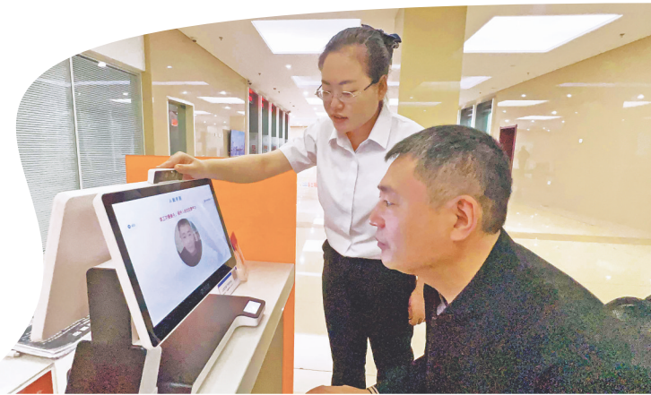
市民在“社保智慧窗”办理业务。

“审批效率的提升,不是简单的‘减时间’,而是用数字技术重构政府与企业的互动模式。让企业感受到,政府不是‘管理者’,而是‘服务者’‘同行者’。”岳立娟说,这种“用户至上”的改革逻辑,让哈尔滨的政务服务从“完成任务”转向“创造价值”。