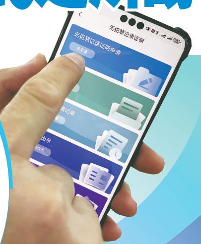
利用手机开具无犯罪记录证明。