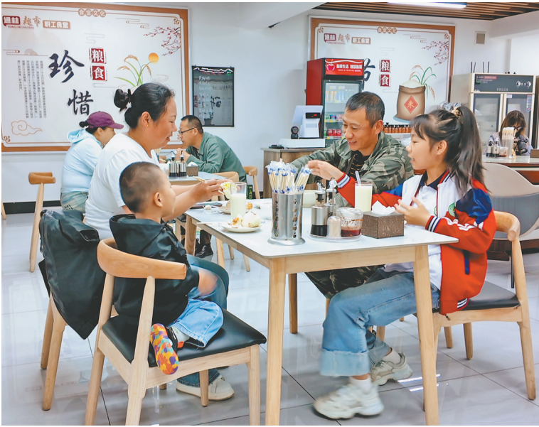
居民群众食堂就餐。