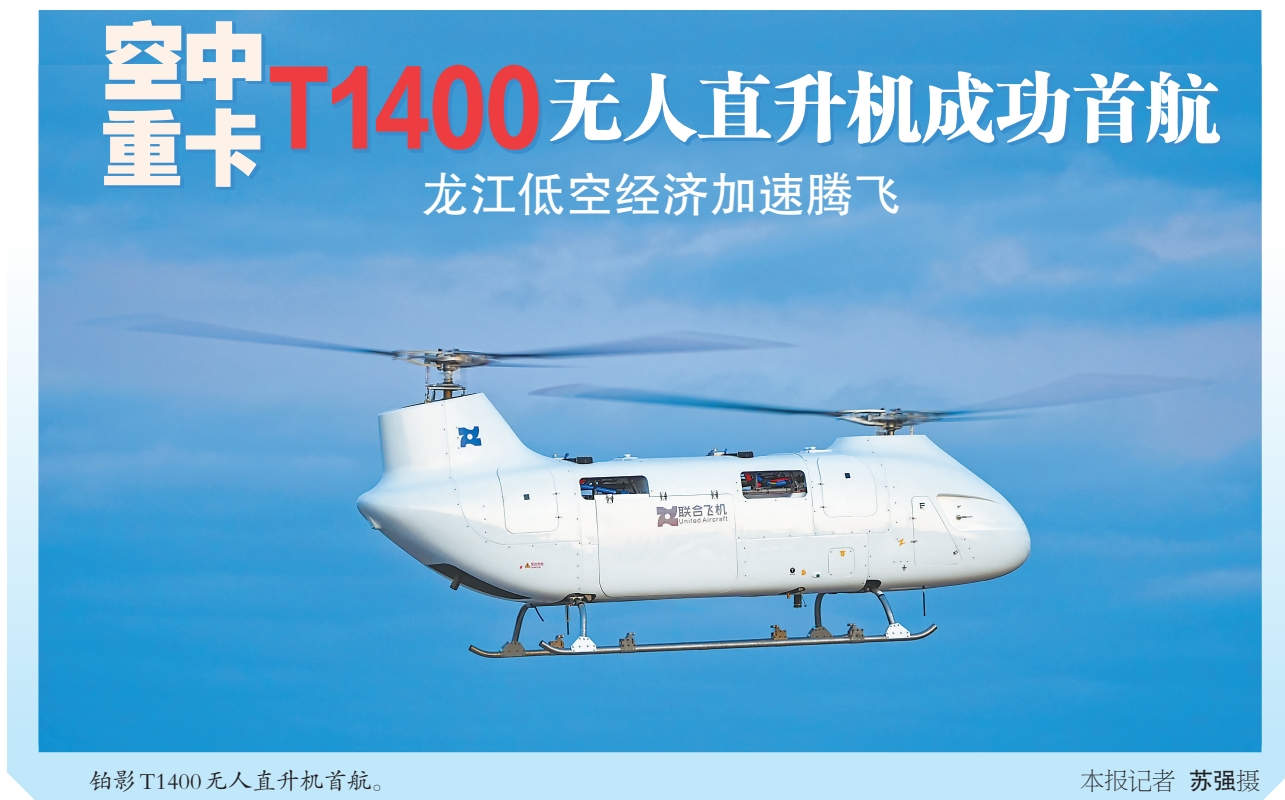
铂影T1400无人直升机首航。