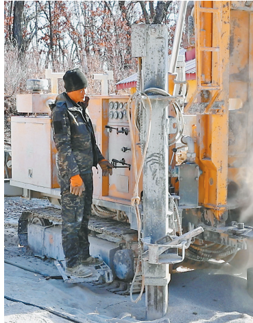
局瞭望员的民生工程全面完成。

今年,省林业工会推出的“工会援聚”行动为工程注入关键力量,在省林业工会与集团大力支持下,施工效率显著提升。最后一座瞭望塔的深水井顺利打通并实现供水,标志着这项惠及全