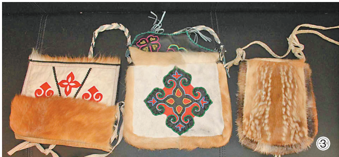
图①:漠河夜空中如梦似幻的极光。 图②:同江文创产业园开发的赫哲族潮牌鱼皮服饰。 图③:鄂伦春族狍皮制品。