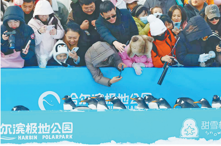
现场观众打卡拍照。