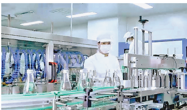
鸡西绿海白桦树汁生产车间。

在工作过程中,森调队员们不停地在山势陡峭的密林中穿梭,一个区域核验完又立刻奔赴下一个区域,似乎是在与太阳抢时间,与野兽比速度。路遇半冰半水的急流浅滩,队员们毫不犹豫地大步跨过,飞溅的河水打湿了裤脚也浑然不觉。