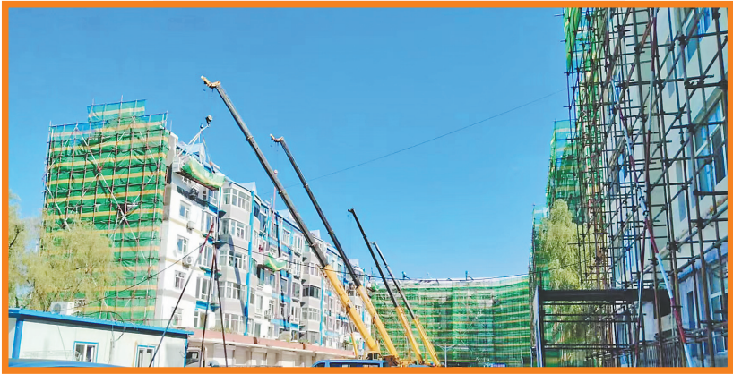
大庆老旧小区改造经验成全国样板。

“十四五”期间,大庆市怀揣“当好标杆旗帜、建设百年油田”的殷殷嘱托,以“1357”现代化产业体系为纲,在转型攻坚中破局突围,在创新驱动中积蓄动能,在生态治理中擦亮底色,在民生改善中传递温度。这座镌刻着工业记忆的英雄城市,正以“多元共兴”的崭新姿态,书写着高质量发展的时代答卷。