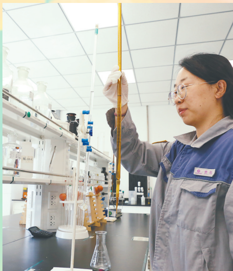
大庆圣泉绿色技术让农民增收近2亿元。

五年栉风沐雨,五年砥砺前行。从“油脉”独兴到“多极”共荣,从科技突破到成果转化,从生态修复到民生提质,大庆的每一步跨越都坚实有力,每一份成就都浸润民心。