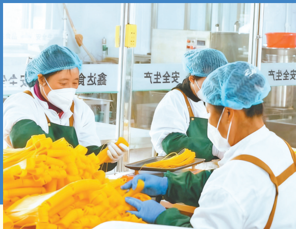
乡村产业持续壮大。

历史的征程波澜壮阔,奋进的脚步铿锵有力。塔吊林立的产业园区,阡陌交通的希望田野,笑语盈盈的街头巷尾……今日之甘南,无数生动的细节,正共同撰写着一份关于“蝶变”的答案:县域的真正振兴,是让发展的红利渗透到每一寸土地,温暖每一个生活其间的人。