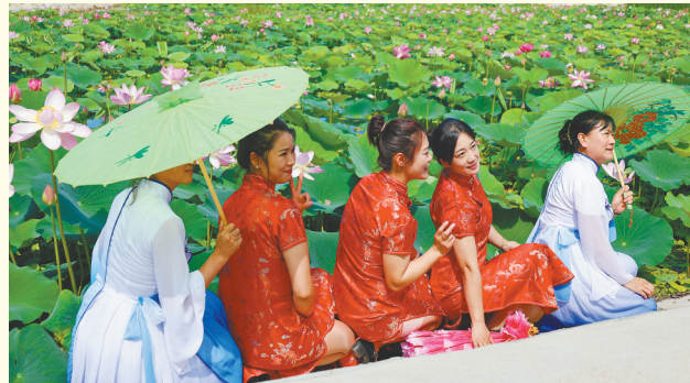
乡村文旅事业蓬勃发展。

五载奋进改革路,千钧重任再出发。行走在这片4791平方公里的甘南大地,城乡融合发展的气息扑面而来,县域经济的活力持续迸发。未来的甘南,将继续沿着城乡融合发展之路稳步向前,让城市与乡村各美其美、美美与共,绘就一幅美丽、繁荣、和谐、幸福的新画卷。