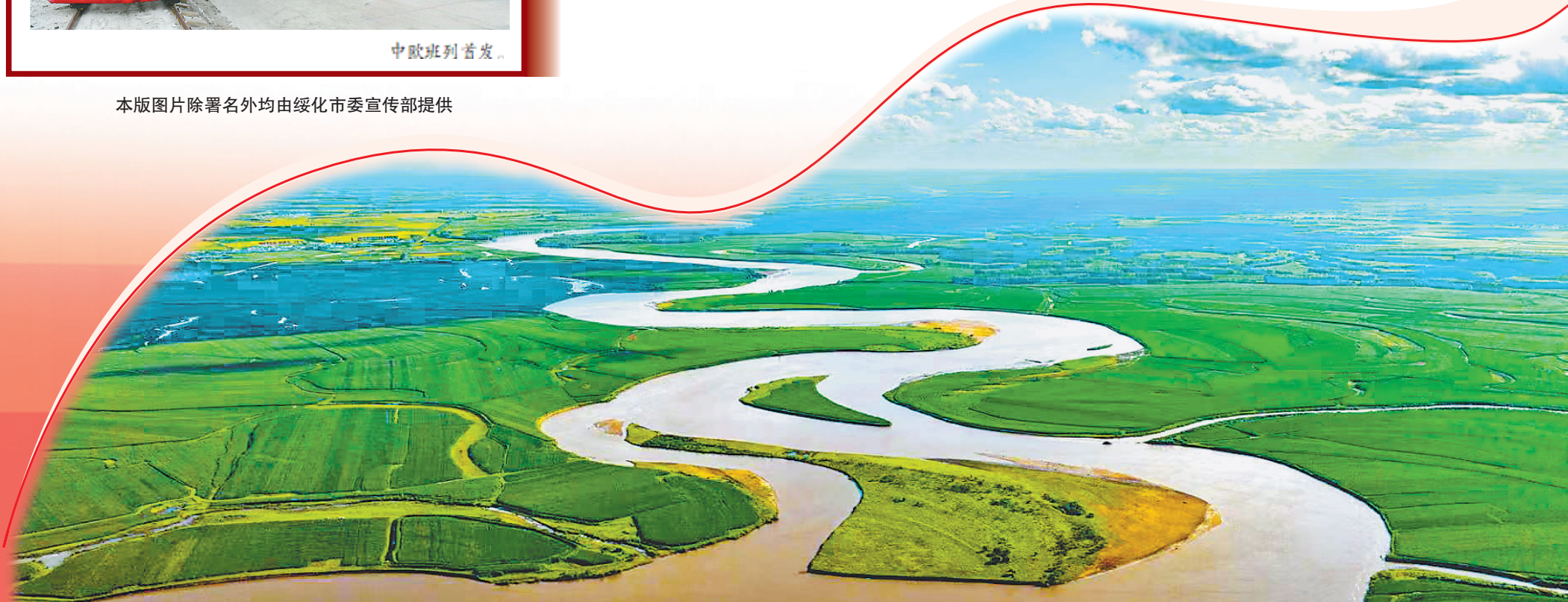
绥化风貌。