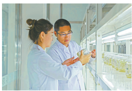
实验育种。

宜居宜业和美乡村加快建设。打造省级宜居宜业和美乡村精品村10个、省级龙江民宿试点村5个、中国美丽乡村乡村2个，村庄规划实现全覆盖。海伦国家级“五好两宜”和美乡村村试点项目全面建成。 全省农产品精深加工业高质量发展推进会议连续两年在绥化市召开，2025年全国粮油大面积单产提升现场推进会在绥化市召开，牵头申报的黑龙省玉米产业集群、兰西县国家现代农业产业园获农业农村部批准立项，国家级农业产业镇遴选到12个。乡村振兴全面推进，脱贫人口人均纯收入年均增长7.7%。