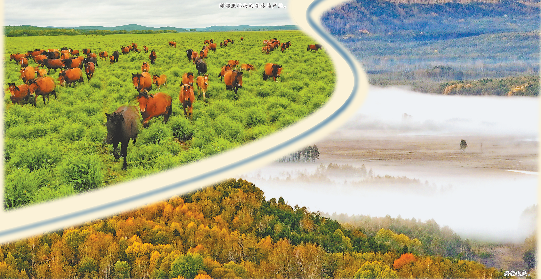
那都里林场的森林马产业。

开放赋能,北疆门户打开“新空间”。立足“中国最北”区位优势,大兴安岭积极融入向北开放大局,2025年上半年外贸进出口同比增长31%,对俄贸易逆势增长56.1%。漠河口岸连砦作业区完工投用,跨境大桥项目稳步推进,自贸区协同发展先导区落地见效,137个签约项目落地率达76.6%,实际利用内资年均增长49.3%。“双买双卖”机制让边境贸易焕发新机。民吾勤兴,市场活力得到“真释放”。3.1万户民营市场主体撑起全区经济“半壁江山”,贡献了62.4%的工业增加值和44.4%的税收,带动2.66万人就业。政务服务持续升级,企业注册半小时办结成为常态;领导干部包联机制精准纾困,帮助鑫和木业等企业化