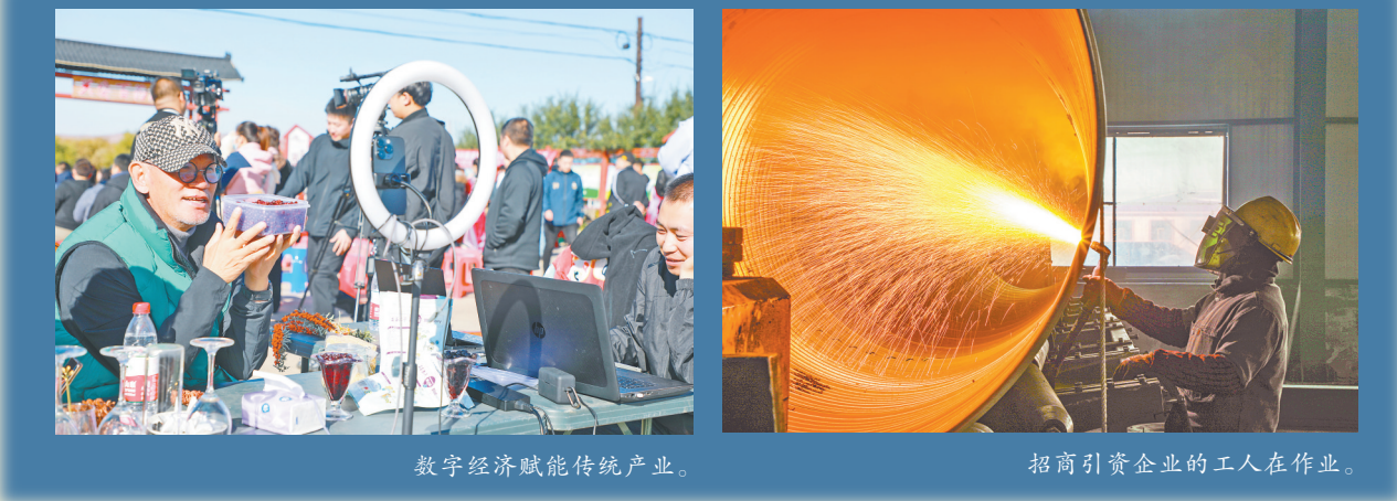
数字经济赋能传统产业。

改革潮涌,击鼓催征。回眸“十四五”,大兴安岭以改革破解发展难题,以创新激发内生动力,各项改革举措落地生根,开花结果。站在新的历史起点,这片北疆林海将继续以改革为帆,以创新为桨,在高质量发展的航道上破浪远航。