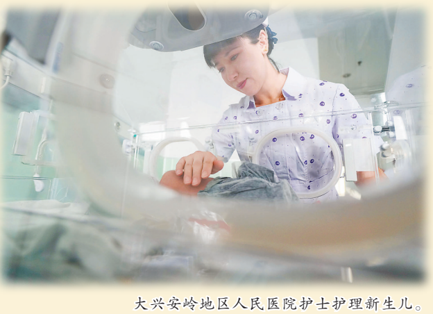
大兴安岭地区人民医院护士护理新生儿。