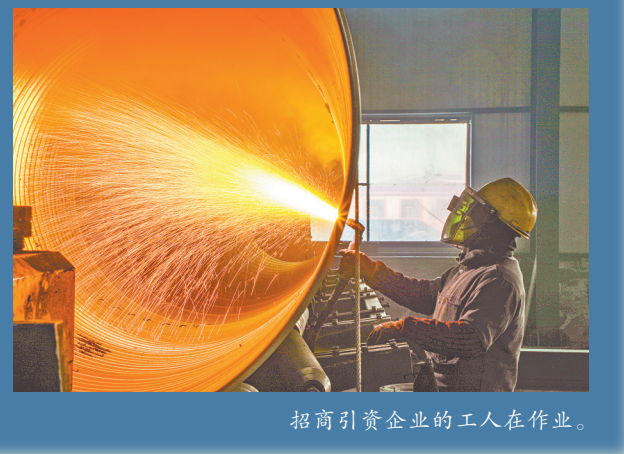
招商引资企业的工人在作业。