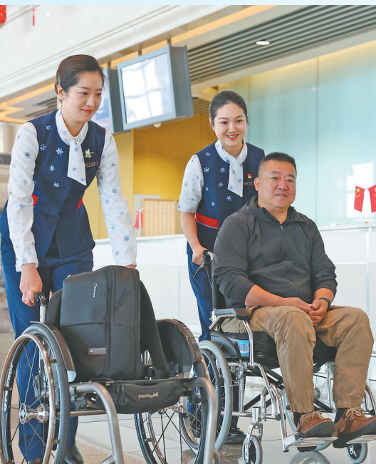
哈尔滨太平国际机场为特殊旅客提供轮椅服务。