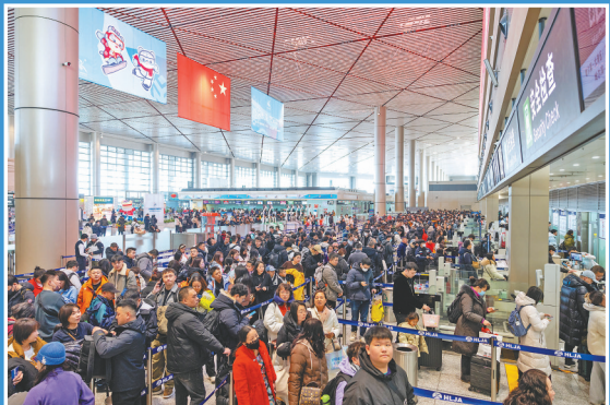
旅客正在有序通过安检。