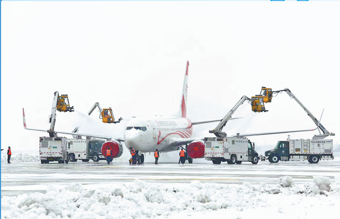
哈尔滨太平国际机场工作人员实施飞机除冰雪作业。

习近平总书记2023年视察龙江时强调,要构筑我国向北开放新高地。黑龙江机场集团党委书记、董事长颜寒表示,集团落实习近平总书记这一重要指示精神,聚焦安全第一、聚焦企业发展、聚焦治理能力、聚焦员工幸福,积极推进国际航空枢纽、机场群、非航业务发展“三大战略”落地,加快国际航空枢纽建设步伐,在构筑我国向北开放新高地中奋勇争先。