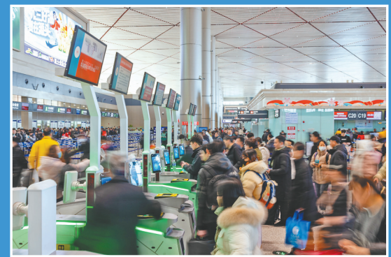
上午10时,哈尔滨太平国际机场迎来第二波客流高峰。