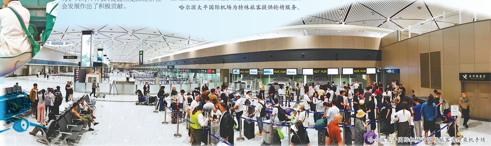
哈尔滨太平国际机场为国际旅客办理乘机手续。