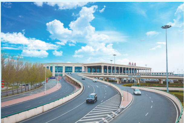
哈尔滨太平国际机场。

人享其行,物畅其流。黑龙江机场集团着力发挥对俄通道优势,全面落实“买全俄卖全国、买全国卖全俄”,全方位打造对俄空中货运通道,稳定运行“哈尔滨——莫斯科”全货机航线。五年间“哈尔滨——莫斯科”全货机航线货运量1.1万吨,有效促进了中国与俄罗斯的经贸往来,加速了要素资源跨国产流动,成为促进龙江经济发展的新引擎。黑龙江机场集团运输飞行起降架次、旅客吞吐量、货邮吞吐量分别由2020年13.8万架次、1644.9万人次、11.6万吨增至2024年20.3万架次、2872.0万人次、14.8万吨;哈尔滨太平国际机场旅客吞吐量连续三年保持东北地区第一,为扩大对外开放、促进黑龙江经济社会发展作出了积极贡献。