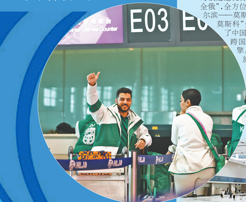
2025年亚冬会,哈尔滨太平国际机场圆满完成航空运输保障工作。