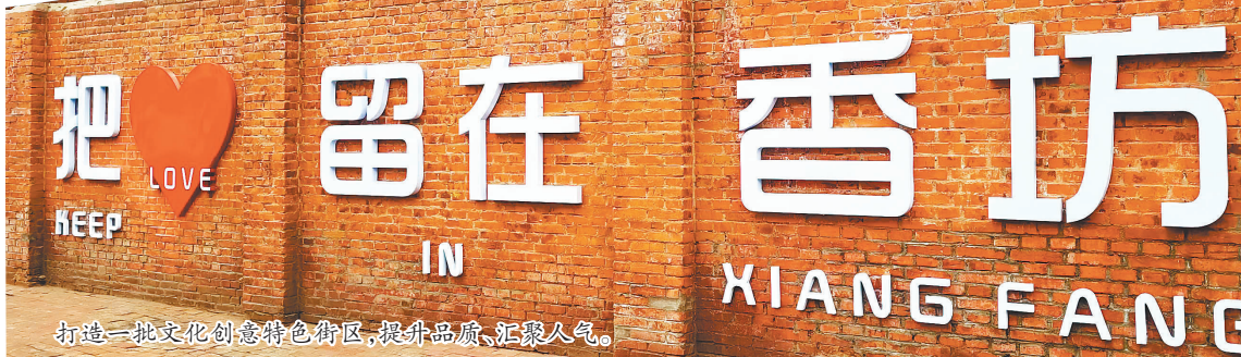
打造一批文化创意特色街区,提升品质、汇聚人气。