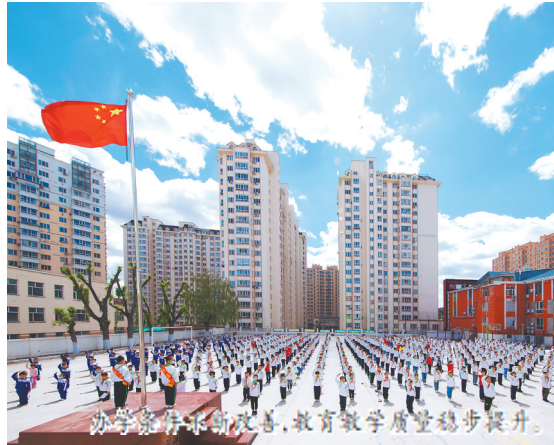
办学条件不断改善,教育教学质量稳步提升。