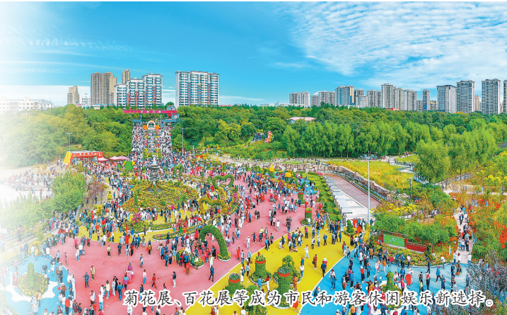
菊花展、百花展等成为市民和游客休闲娱乐新选择。

开放空间不断拓展。发挥省级香坊经济开发区平台效应,与哈尔滨综合保税区、铁路国际集装箱中心站等对外开放平台联动发展,形成我省开放层次最高、优惠政策最多、功能最齐全、手续最简化的特殊开放区域和“一带一路”的重要节点。“一带一路汽车保税出口基地”正式启动运营,中购集团全球汽配产业进出口加工集散物流中心落成,运输时效大幅压缩,综保区跨境电商出口规模进一步扩大。