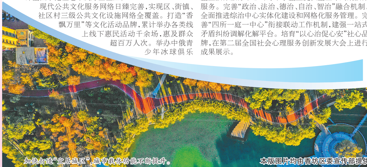
加快打造“宜居城区”,城市载体功能不断提升。

法律服务网络全覆盖,建成区、街镇、村居三级服务平台202个,覆盖率达100%。打造全市首家“中小企业法律服务中心”,为中小企业提供全生命周期法律服务。完善“政治、法治、德治、自治、智治”融合机制,全面推进综治中心实体化建设和网格化服务管理。完善“四所一庭一中心”衔接联动工作机制,建强一站式矛盾纠纷调解化解平台。培育“以心治促心安”社心品牌,在第二届全国社会心理服务创新发展大会上展示成果。