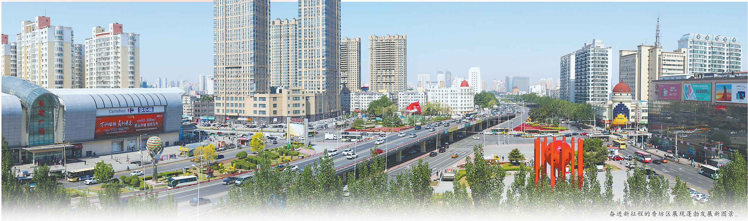
奋进新征程的香坊区展现蓬勃发展新图景。

责编:刘 莉(0451-84655327) 执编/版式:李爱民(0451-84655652)