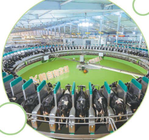
飞鹤乳业自动化挤奶大厅。