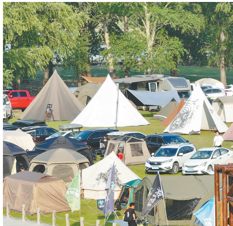
全力叫响“北方露营之城”品牌。

实力更强、底气更足,不仅体现在经济总量的跃升上,也体现在质量效益的改善上。经过改造的智能化生产线24小时运转,飞转的机床、跳动的数据……书写着老工业基地振兴的崭新答卷,描绘出高质量发展的新图景。