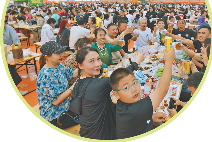
烤肉美食节热闹非凡。

聚力高质量,实现新跨越。站在“十四五”收官的时间点回望,这5年,齐齐哈尔市在构建“2345”现代化产业体系、推进农业农村现代化、扩大对外开放合作等方面不断实现新突破、创造新辉煌,谱写了一曲曲高质量发展、可持续振兴的时代壮歌。