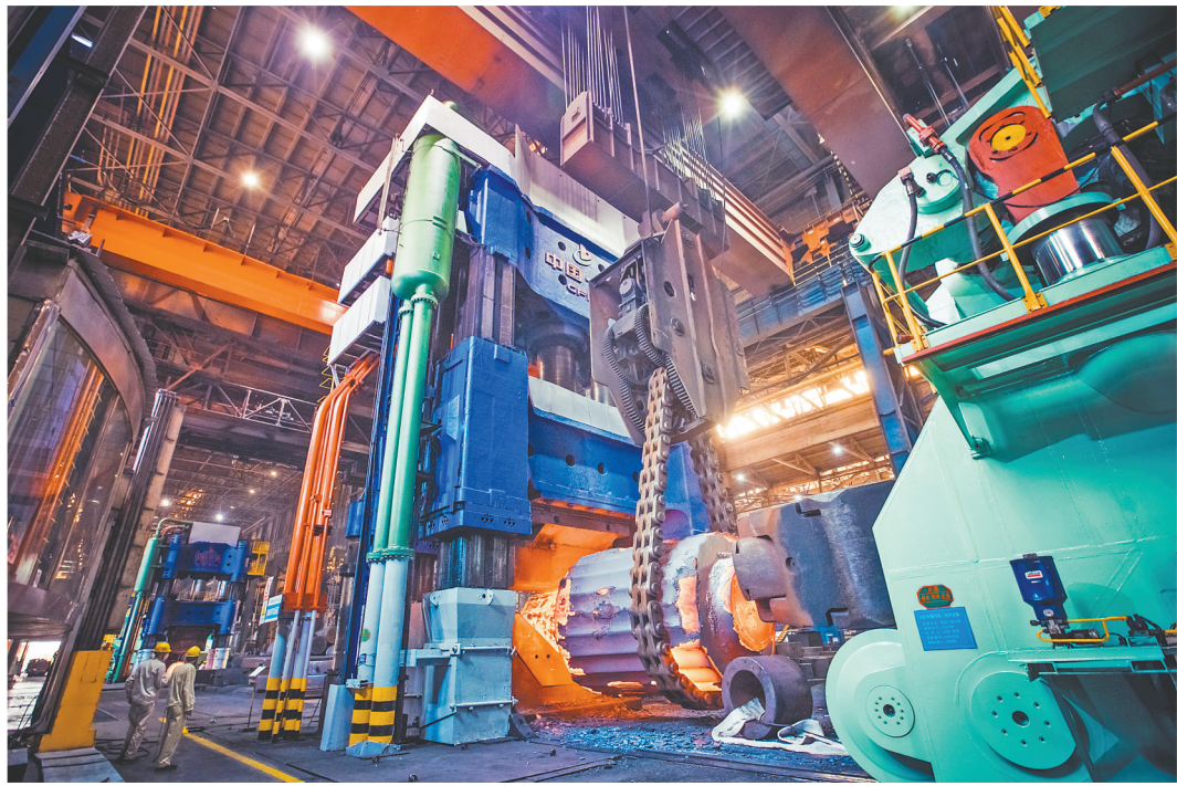
中国一重15000吨水压机工作画面。

严格实施耕地保护制度,大力推动“五良”融合发展,因地制宜发展新型农业经营体系,深入实施种业振兴行动,协同推进农业机械化、智能化……齐齐哈尔市为农业插上腾飞的翅膀,努力让“中国饭碗”装上更多“鹤城粮”。