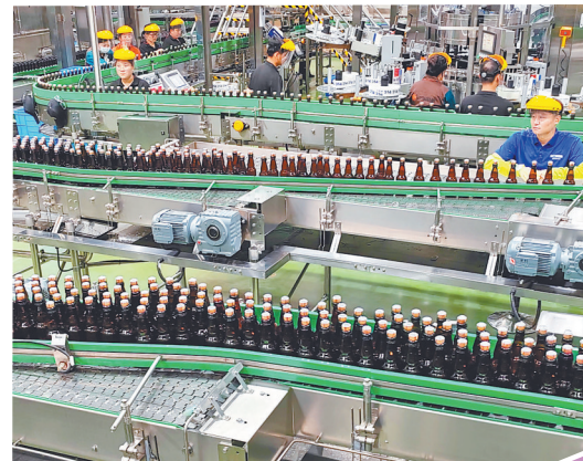
辛巴赫生物科技有限公司啤酒生产线。