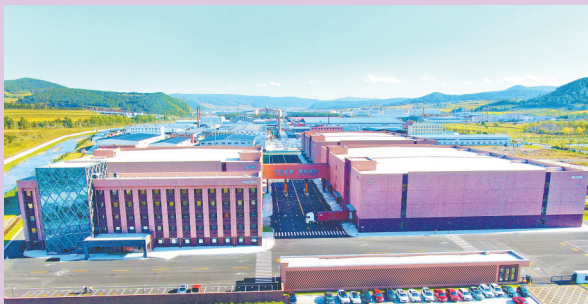
玛连玛汽车配件出口基地。

聚焦平台提质,营造服务完备的发展环境。强化跨境投资合作,鼓励和支持企业由“走出去”向“走进来”转变提升,建立跨境产业综合体,片区自挂牌以来,新增对俄投资项目9个,累计达到74家企业,建设境外园区7家,占全省44%,16家企业入驻俄罗斯符拉迪沃斯托克自由港和超前发展区,占全省42%。境外投资涵盖林业、农业、渔业、批发、物流等领域,境外取得林权504.05万公顷,购买、租赁土地13.55万公顷,水产养殖面积6.5万亩。推动园区产业集聚,推进“管委会+公司”改革,实施“园区满园计划”,边合区和综保区打造不同的产业格局。深化区域交流合作,加强与广东南沙片区对口协作,与牡丹江市东安区等地签署框架协议,在多个领域深化合作,促进产业链贯通、供应链对接。