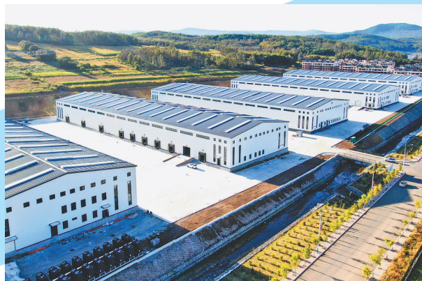
天府盛边境云仓项目。

围绕金融国际化创新突破。57项金融国际化案例中,12项省级案例亮点纷呈。《跨境金融创新助力贸易新业态发展》获评2023年度地方全面深化改革典型案例,入编《中国改革年鉴(2024卷)》。复制广西自贸试验区的《边境地区跨境人民币使用改革创新》案例,创新开展跨境人民币卢布双币种常态化调运,累计调运78笔,金额22.68亿元,实现跨境资金秒到账。打造“金融超市、跨境金融工作站、跨境结算中心、企业上市服务站、绥易融”五平台协同矩阵的金融服务综合体,金融产品种类大幅增加,为贸易发展提供了坚实的金融保障。