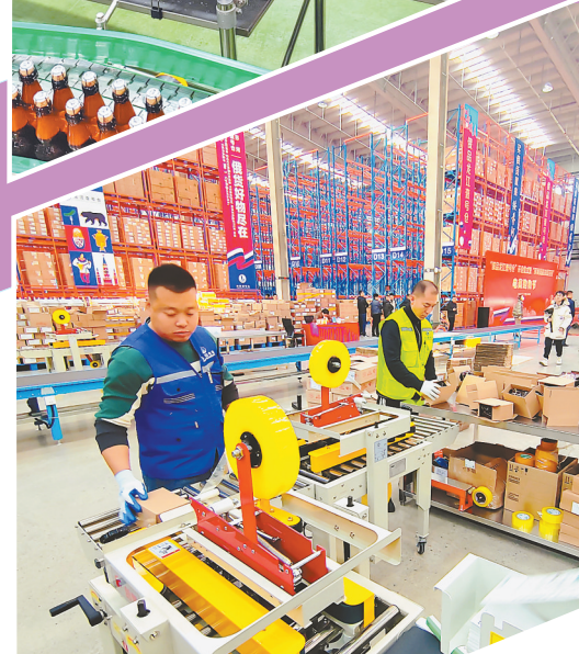
跨境电商发货现场。