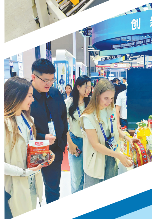
第三十四届哈洽会上绥芬河绥易购展区受关注。