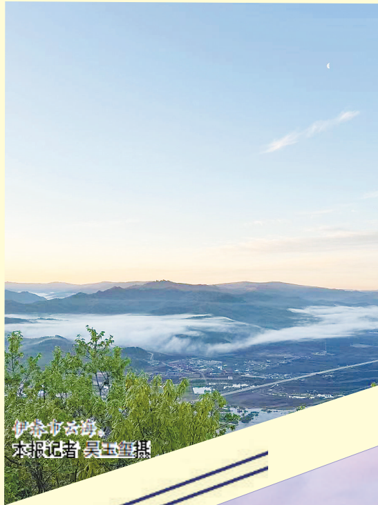
伊春市云锦。

征途漫漫,惟有奋斗。展望“十五五”新征程,省生态环境系统将牢牢把握高质量发展首要任务,系统谋划“十五五”时期生态环境保护目标指标、重点任务、重大工程和政策举措,切实把绿色龙江建设目标任务转化为明确的工作计划和扎实行动举措,加快构建人与自然和谐共生的美丽龙江。