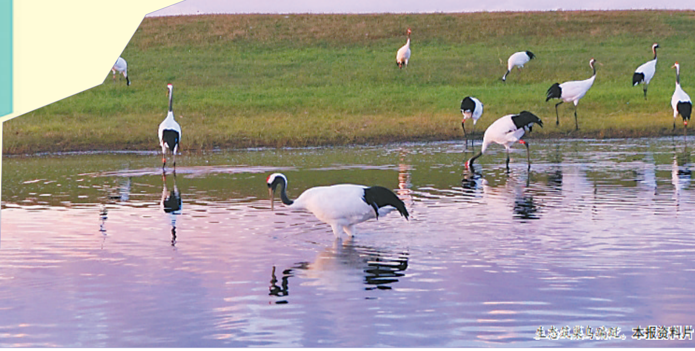
生态成果鸟归处。本报资料片