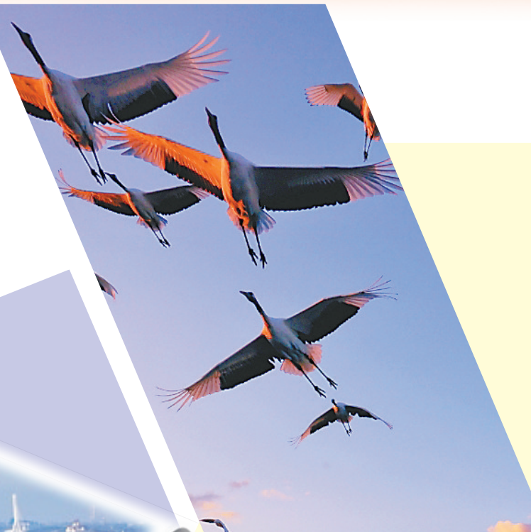
良好的生态环境引众多鸟类来我省“安家”。