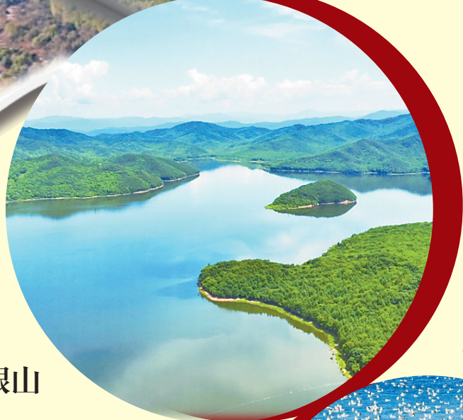
←磨盘山水库。