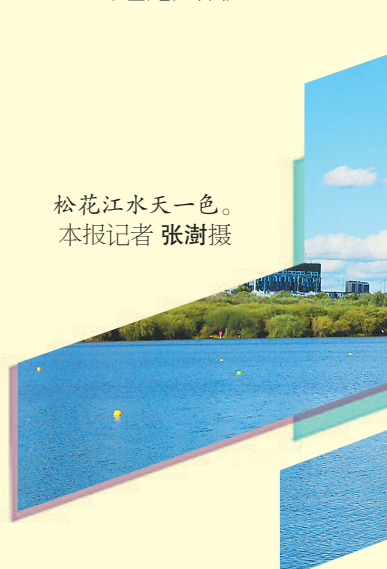
松花江水天一色。

目前,我省已有30条(个)河湖(水库)被认定为省级美丽河湖,哈尔滨市磨盘山水库入选生态环境部第三批美丽河湖优秀案例,形成了独具龙江特色、可复制、可推广的美丽河湖保护与建设经验,生动演绎着人与自然和谐共生的绿色龙江样板。