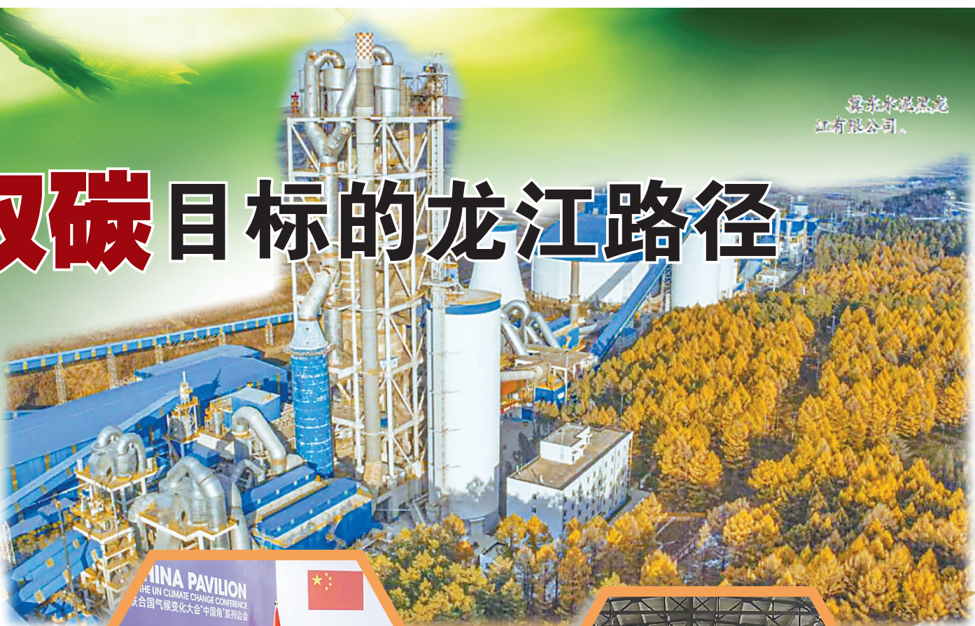
黑龙江水泥集团 有限公司。

省林草局相关负责人表示,首例案件的成功实践,验证了林业碳汇赔偿机制在我省实施的可行性。通过“龙江绿碳”认购这一市场化手段,将森林的固碳潜能转化为可量化的司法赔偿,不仅让生态破坏者承担了修复责任,更开辟了“龙江绿碳”稳定的消纳途径,加速了林业碳汇生态价值向经济价值的转换。