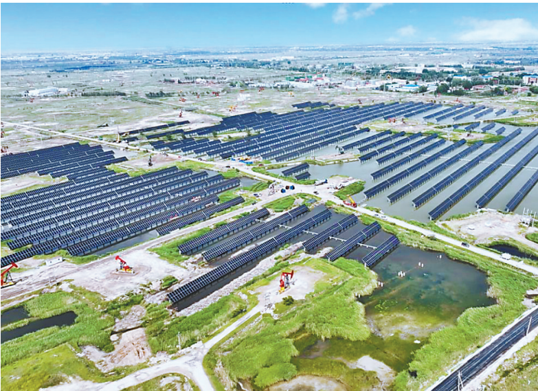
大庆油田有限责任公司水面光伏示范工程。

省生态环境厅将持续强化对重点排放单位碳排放数据质量的监督管理,有针对性地开展专题培训,不定期带领专家团队赴企业开展精准指导与技术帮扶,及时回应企业诉求,建立健全长效沟通机制,全面推动我省企业碳排放数据质量管理再上新台阶。