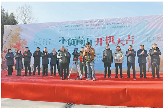
开机仪式。

本报讯(记者唐海兵)近日,国内首部以东北虎豹国家公园为核心背景的院线电影《不负青山》在牡丹江市东宁市民草局朝阳沟林场举行开机仪式。这部由国家林草局指导、东北虎豹国家公园管理局、黑龙江省委宣传部、黑龙江省林草局联合摄制的影片,将以生态保护与电影艺术的创新融合,为大美龙江的生态故事拉开光影叙事的序幕。