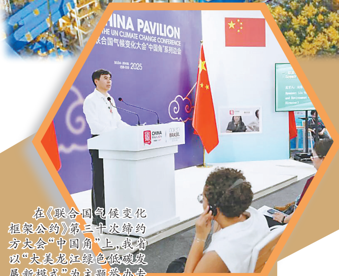
在《联合国气候变化 框架公约》第三十次缔约 方大会“中国角”上,我省 以“大美龙江绿色低碳发 展新模式”为主题举办专 场活动。