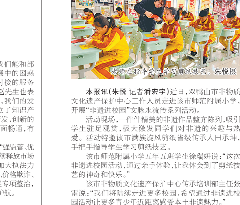
老师在指导学生剪纸技艺。