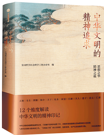
《中华文明的精神追求》/全国哲学社会科学工作办公室/中信出版社/2025年8月

主编:文天心 责任编辑:于晓琳 执行:许晓彤 美编:倪海连 投稿邮箱 read0451@163.com