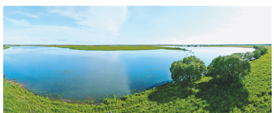
三江国家级自然保护区(资料片)。