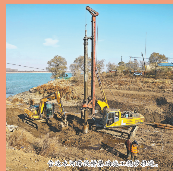
音达木河跨线桥基础施工稳步推进。