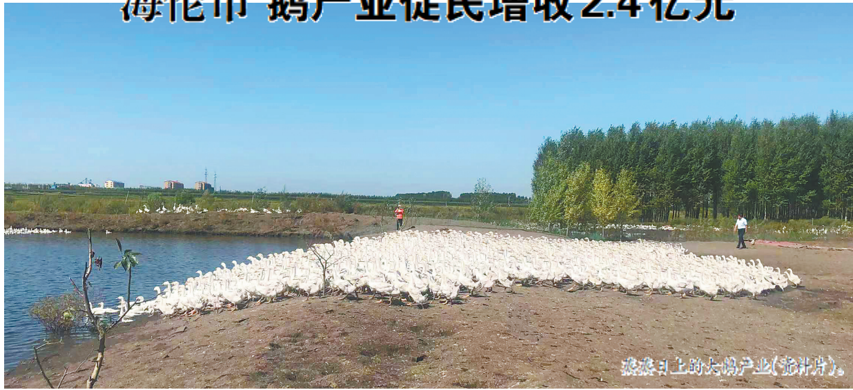
海伦市的大鹅产业(资料片)。