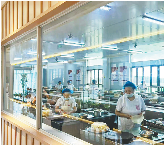
工人们正在烙制筋饼。

“希望游客在这里不仅能品尝筋饼,还能体验筋饼文化。我们未来的方向就是开展‘美食+文旅+研学’等一系列活动,这将成为园区的一个核心业务。”陈思浩说。