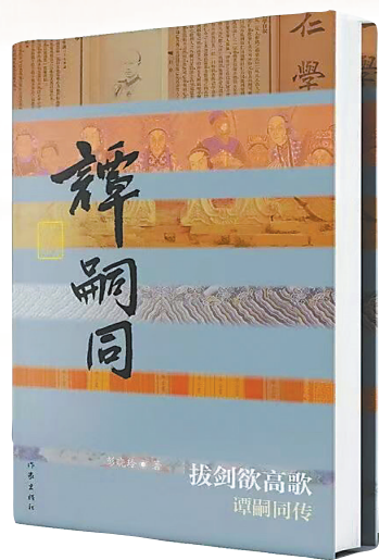
《拔剑欲高歌——谭嗣同传》/ 彭晓玲/作家出版社/2025年9月

在中国近代史的璀璨星空中，谭嗣同的名字犹如一颗燃烧的流星，短暂而炽烈，他的诗句“我自横刀向天笑，去留肝胆两昆仑”镌刻在民族记忆深处。然而，在很长一段时间里，谭嗣同的形象被不同程度地符号化——他或是教科书里慷慨就义的“戊戌六君子”之首，或是爱国主义的标准化符号，其思想的多维性与人格的复杂性被单一的革命叙事所遮蔽。彭晓玲的《拔剑欲高歌——谭嗣同传》正是一部试图穿透历史迷雾，为这位近代思想先驱“复魅”的力作。它不仅满足于呈现一位烈士的悲壮，更致力于还原一个“完整