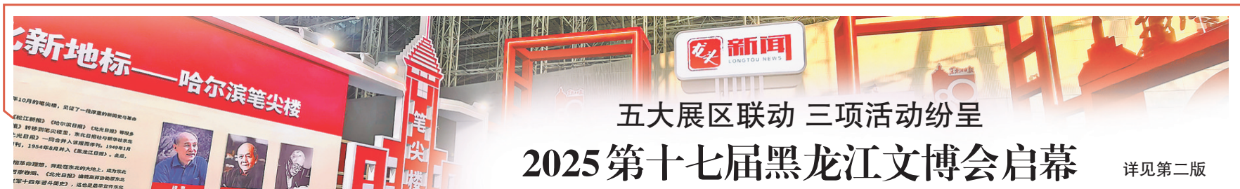
五大展区联动 三项活动纷呈