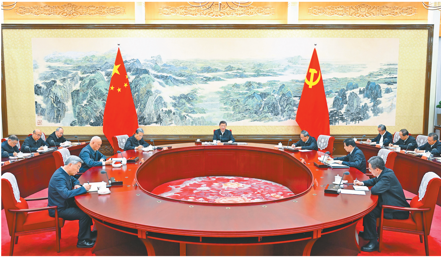
12月25日至26日,中共中央政治局召开民主生活会,中共中央总书记习近平主持会议并发表重要讲话。