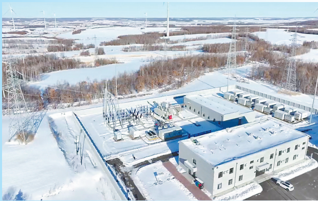
32台“大风车”已全部投入运行。

本报讯(迟浩然 记者赵吉会)近日,省重点建设项目——中广核新能源孙吴200MW风电项目实现全容量并网发电。蓝天白云下,随风起舞的“白色森林”正成为孙吴县一道崭新的风景线,目前32台“大风车”已全部投入运行。今后这片风场每年将提供超过5亿度的清洁电力,成为推动地方绿色转型、可持续发展的强大引擎。