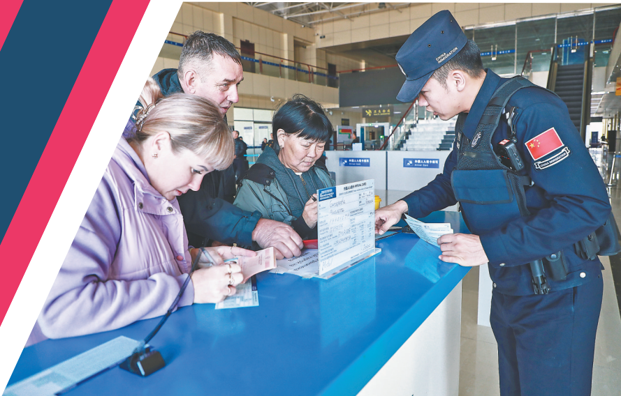
俄语便民小分队民警指导俄罗斯游客填写入境卡。

锻造发展底色。面对发展难题,北安乡镇干部以创新破壁垒,以实干淘真金。杨家乡以定制农业为主线,牵头打造“北杨定制”微信小程序,推出“云采摘”“云腌制”专属订购计划,累计销售额已突破560万元,生产的麻酱鸡蛋更成为2025年中俄跨境马拉松赛事官方补给食品;主星朝鲜族乡推进稻米加工标准化体系建设,加快推进厂房硬化、设备引进和地磅安装等基础设施建设,二期设备已完成调试,投产后预计年加工稻米3万吨;海星镇干部深入田间,推动全流程托管示范田建设,技术托管面积达13.3万亩。