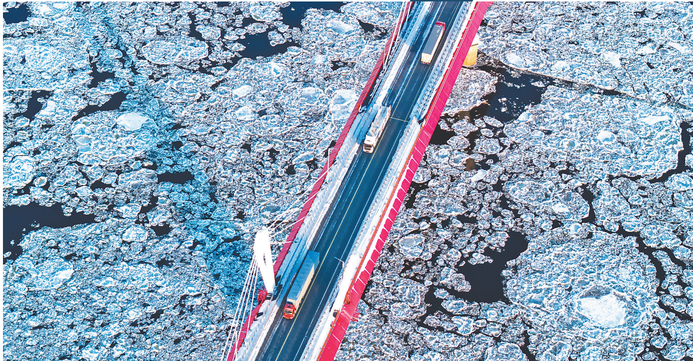
黑龙江大桥上跨境电商物流车穿梭不息。

中俄互免签政策这把“钥匙”,不仅打开了人员、货物通行的大门,更解锁了“中俄混搭”的生活新图景——黑龙江大桥上跨境电商物流车穿梭不息,中俄家庭周末团聚成常态,职能部门的贴心服务让界江不再是距离。一场关于“新生”与“共生”的变革,正在边境线上悄然发生。