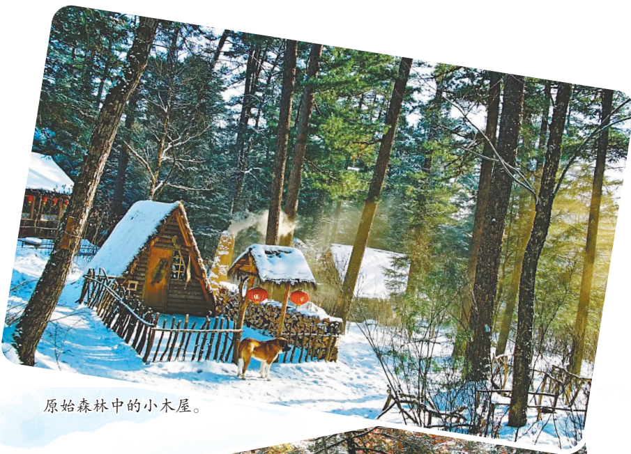
原始森林中的小木屋。