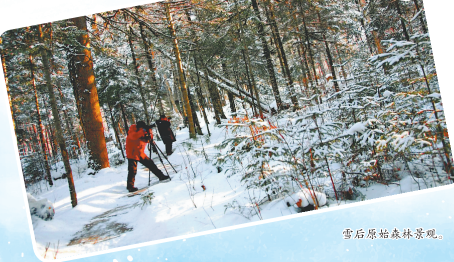
雪后原始森林景观。