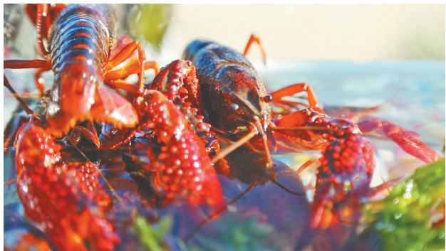
方正县寒地小龙虾。

如果说黑土地是大自然的馈赠,那么“富硒”则是方正县独有的“黄金密码”。这里的土壤平均含硒量高达0.23毫克/公斤,且拥有36条大小河流带来的清冽山泉。