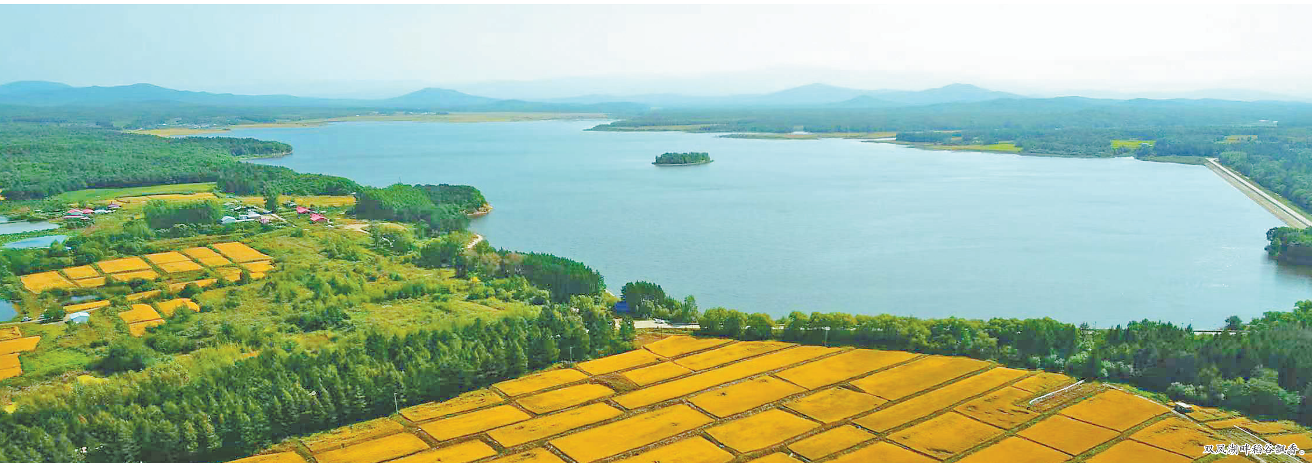
双凤湖畔稻谷飘香。

不仅如此,莲花节还“莲”动了周边的餐饮、民宿产业,巴扎尔莫民俗村等项目借势火爆,让周边村民吃上了“旅游饭”。方正县用一朵莲花,不仅美了生态,更活了经济,富了百姓。