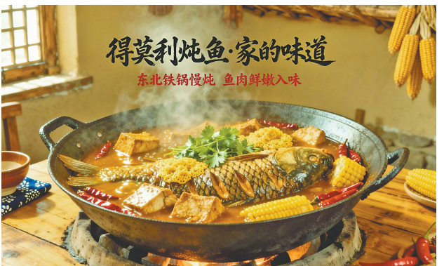
香飘四方的“得莫利炖鱼”。

在得莫利镇,空气中似乎都飘着炖鱼的香味。这个坐落在松花江畔的小镇,凭借着独特的地理位置、优质的江水资源和高负氧离子环境,获评“黑龙江特色气候小镇”。但真正让它名扬天下的,是一道美食——“得莫利炖活鱼”。