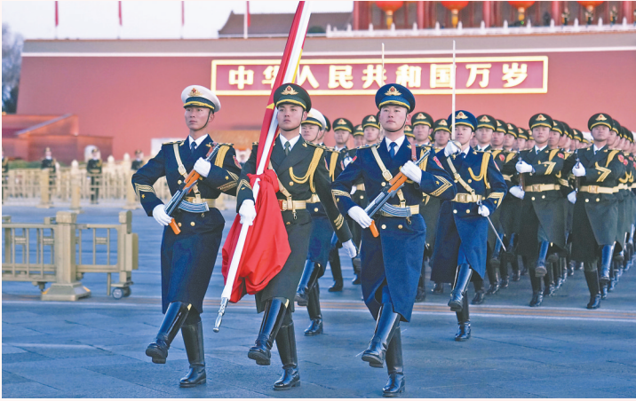
↑2026年1月1日清晨,北京天安门广场举行隆重的升国旗仪式。