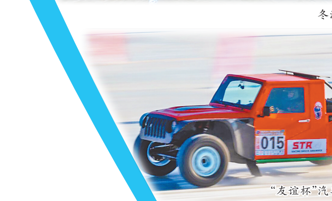
“友谊杯”汽车场地赛开赛。