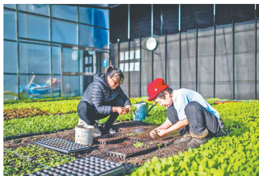
富硒蔬菜大棚绿意盎然。