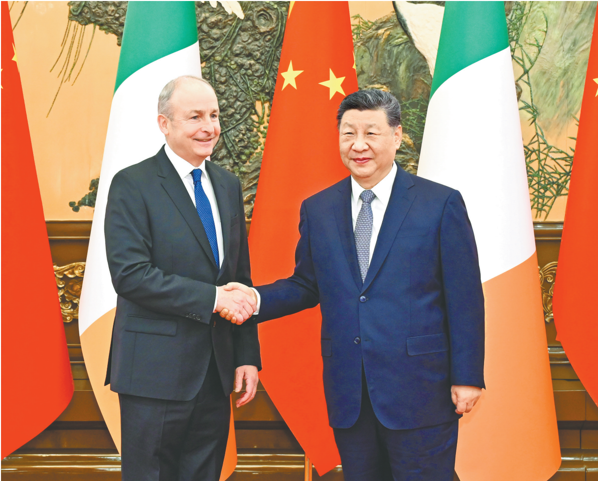
一月五日上午，国家主席习近平在北京人民大会堂会见来华进行正式访问的爱尔兰总理马丁。