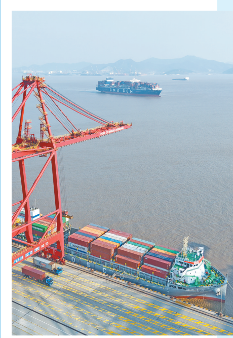
左图:2026年1月8日,货轮停靠在宁波舟山港梅山港区码头。