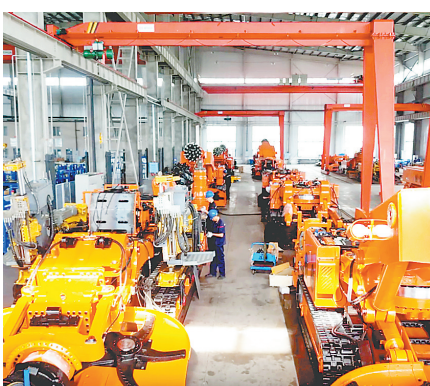
佳木斯煤矿机械有限公司生产车间。

655万吨,同比增长18%。机电、高新技术产品出口强势增长,中药材、罐头等新品类批量进口,花卉实现全省首次批量出口,外贸结构持续优化,开放型经济韧性十足。