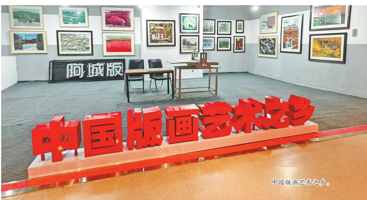
中国版画艺术之乡。

版画无言，却讲述着动人的龙江故事；刻刀虽小，却镌刻着新时代的文化自信，执“新”为笔，镌刻时代印记。