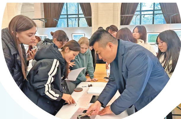
三江美术职业学院俄罗斯留学生来阿城版画艺术园区体验游。

基者的开拓与坚守，到“双联”模式的精准对接，美育普及的持续蓄力；再到以谢崇为代表的中坚力量对品牌化、产业化的大胆探索……生生不息，一代代阿城版画人拓路前行，为阿城版画的未来，照亮了传承与创新之路。