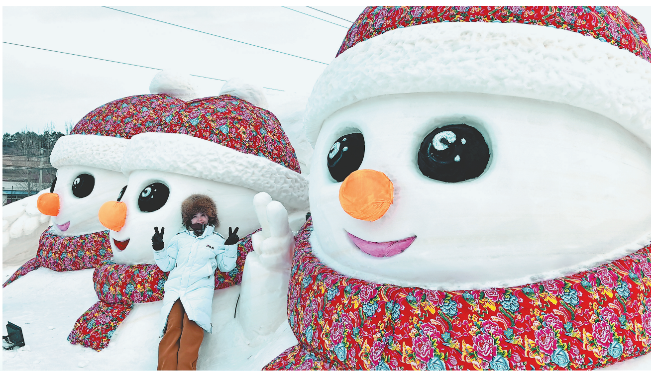
“一家三口”主题大雪人。

银装素裹，雪映欢颜。伴随着喧天的锣鼓和热烈的欢呼，日前，牡丹江阳明·冰雪嘉年华热情开启。平日静谧的牡丹江市阳明区临江村，瞬间化为沸腾的冰雪欢乐海洋，拉开了今冬“文旅+冰雪”深度融合的精彩序幕。