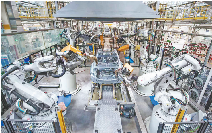
沃尔沃汽车大庆工厂。