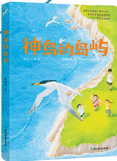
《神鸟的岛屿》/陈伟军/浙江教育出版社/2025年7月

诚如所言,“守护一只鸟,就是守护一座岛、一片海,更是守护我们共同的未来。”《神鸟的岛屿》是值得少年一读的儿童生态文学作品,让生态保护不再抽象,让少年成长可感可触。